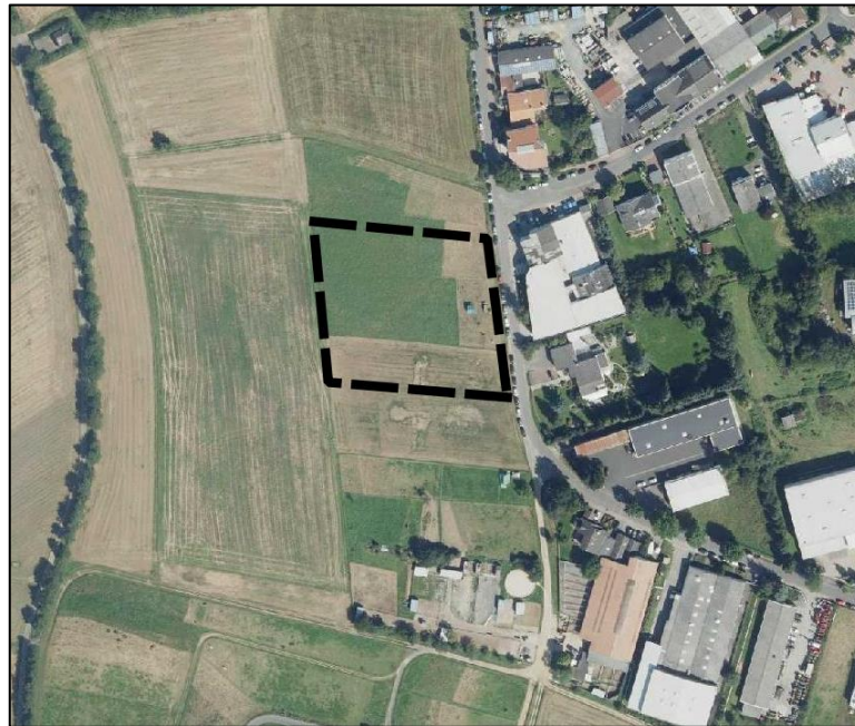
Abbildung 2: Luftbildauszug mit Lage des Plangebietes (gestrichelt).

Das Plangebiet umfasst das Flurstück 10/1 der Flur 8, Ober Mörlen, wird als Pferdeweide genutzt und hat eine Brutto-Fläche: ca. 7.753,7 m 2