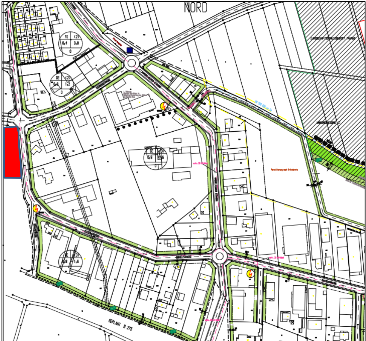
Abbildung 3: Auszug aus dem rechtskräftigen Bebauungsplan 3a „Gewerbegebiet“ inkl. 3. Änderung mit ungefährender Lage des Vorhabens (rot)